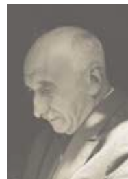
Alfred de Vigny 1797-1863