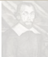
Fénelon 1651-1715 Montesquieu 1689-1755