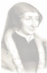
Marguerite de Navarre 1492-1549