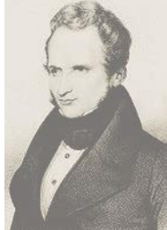
Eugène Le Roy 1836-1907