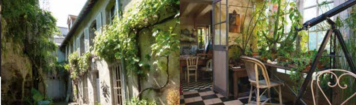
Exposition Duras à Neauphle