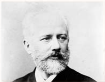
Tchaikovsky, Quatuor n°1, 1er et 2ème mouvements