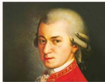
Mozart Quatuor K421