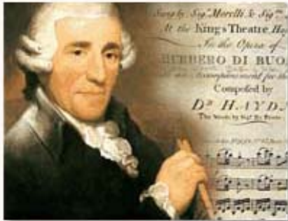
Joseph HAYDN Quatuor opus 76, n°4