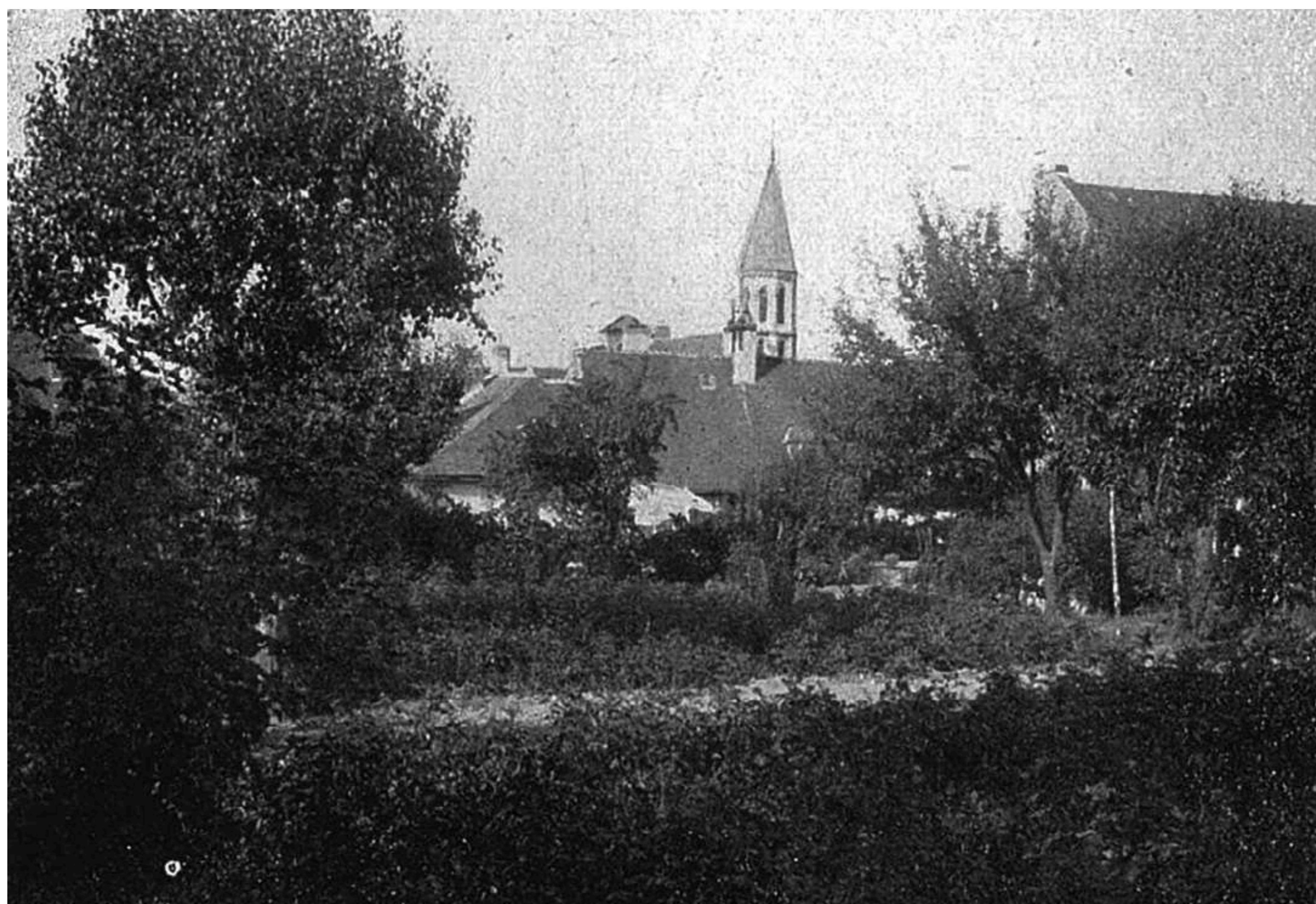
La maison des Jouhandeau, vue du fond de leur jardin

Une ville imaginaire, qui contrairement au Combray de Marcel Proust, fume du sang des bêtes, et non de la chaleur du thé. Surtout, Jouhandeau ne se limite pas à ses souvenirs d'enfance, mais ravive des récits bien antérieurs à sa naissance, élevant la chronique d'un petit bourg de province au rang d'un mythe.